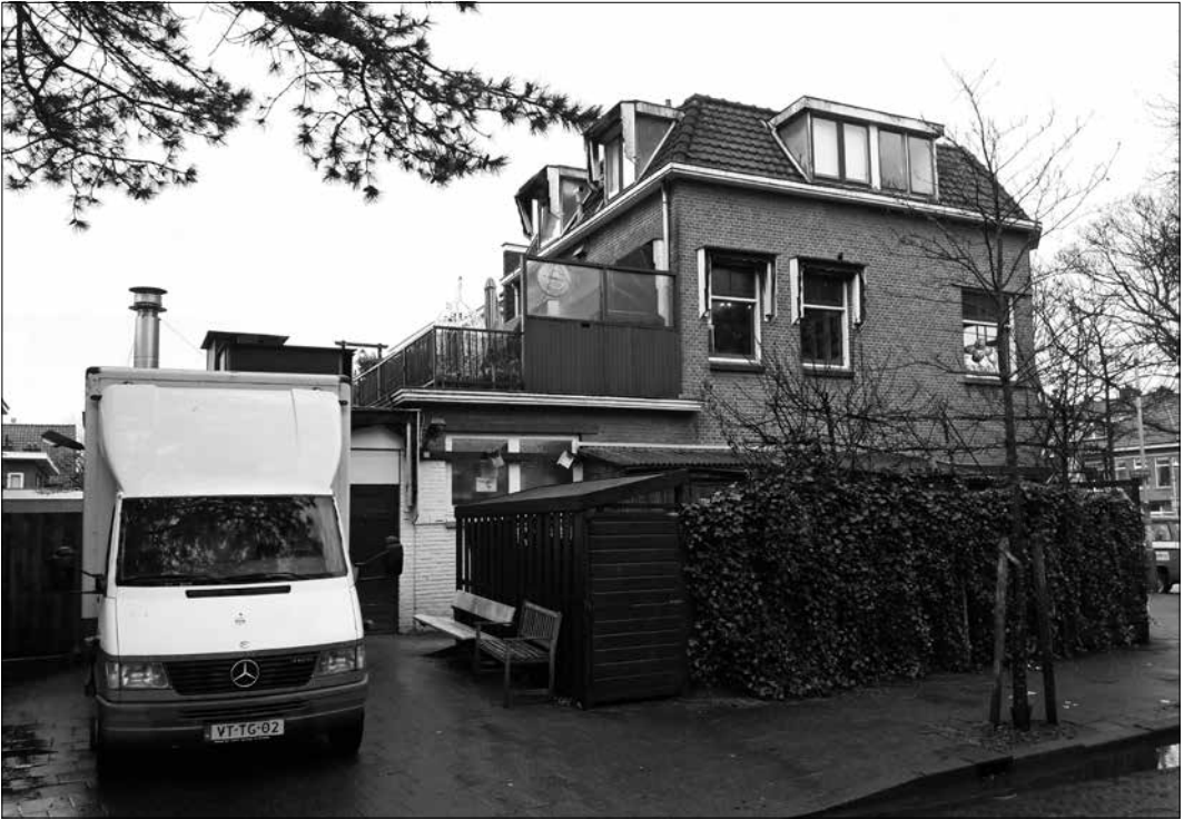
De ingang van de bakkerij aan de kant van de Zwaluwlaan

lig broodbakken volgens het huidige bestemmingsplan niet toegestaan, maar op grond van 'overgangsrecht' mag de broodproductie toch worden gecontinueerd. De bakkerij bestaat immers al sinds 1926. Op 24 juli van dat jaar stond in de Haagse dagbladen het volgende berichtje: B en W hebben vergunning verleend aan W.H. van Houdt tot het oprichten van een brood-, koek- en banketbakkerij met door electromotoren gedreven werktuigen in het in aanbouw zijnde perceel hoek Meezenlaan en Zwaluwlaan.