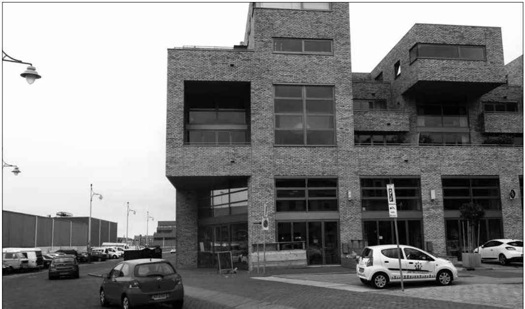
Het hoekpand met de lunchroom aan de Hellingweg.

Belangstellenden kunnen bij Dierckx & Dierckx terecht voor ontbijt, lunch en borrel. In de zomermaanden is de kaart wat uitgebreider en staat er bijvoorbeeld ook een daghap op het menu. Catering of picknick is ook mogelijk, evenals vergaderingen en feestjes, want er is ook nog een ruimte op de eerste verdieping. „Al onze producten zijn vers en glutenvrij en zijn huisgemaakt of worden betrokken bij kleine ondernemers uit de buurt. Het brood nemen we af van onze wijkgenoot Victor Driessen.” Bij Dierckx & Dierckx reserveren kan telefonisch via 06 24741472 of via info@dierckx-dierckx.nl